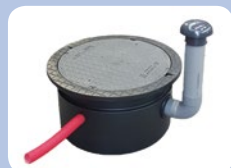
Regard technique pour compresseur d'air (livré avec kit d'alarme déportée)