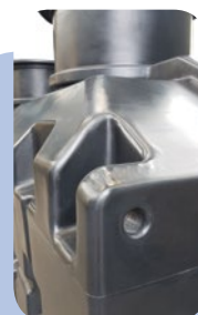
Anneaux de levage

Les eaux usées traitées et les boues biologiques en excès s'écoulent du réacteur biologique dans le clarificateur. Les boues décantent en fond de clarificateur pour être extraites vers le décanteur primaire par une pompe à injection d'air (air lift). Un dispositif siphonoïde en sortie permet la rétention des flottants et une meilleure qualité des eaux rejetées. Les eaux usées traitées se clarifient et s'écoulent vers une zone d'infiltration ou dans le milieu hydraulique superficiel , selon la perméabilité du terrain.